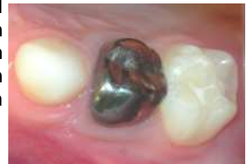
Milchzahnkrone im Seitenzahnbereich

Je nachdem, wo sie eingesetzt werden, ändert sich auch das Material der Krone. So werden im Backenzahnbereich vorgefertigte Kronen aus silberfarbenem Edelstahl verwendet.