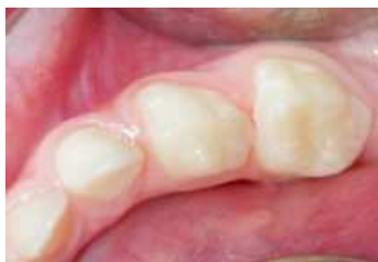
Kunststofffüllungen an Milchbackenzähnen

Ist es zu einer Karies im Milchgebiss gekommen, muss die Karies entfernt und die verlorene Zahnschubstanz durch eine Füllung ersetzt werden.