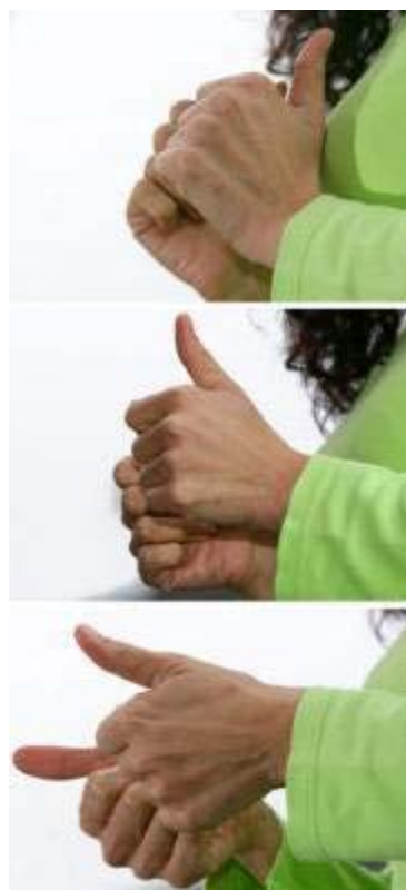
"Ich brauche Hilfe", bedeutet diese Gebärde. Aber wie viele Menschen können den Hilferuf verstehen?