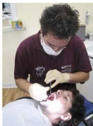
... die ohne Angstgefühl durchgeführt wird.